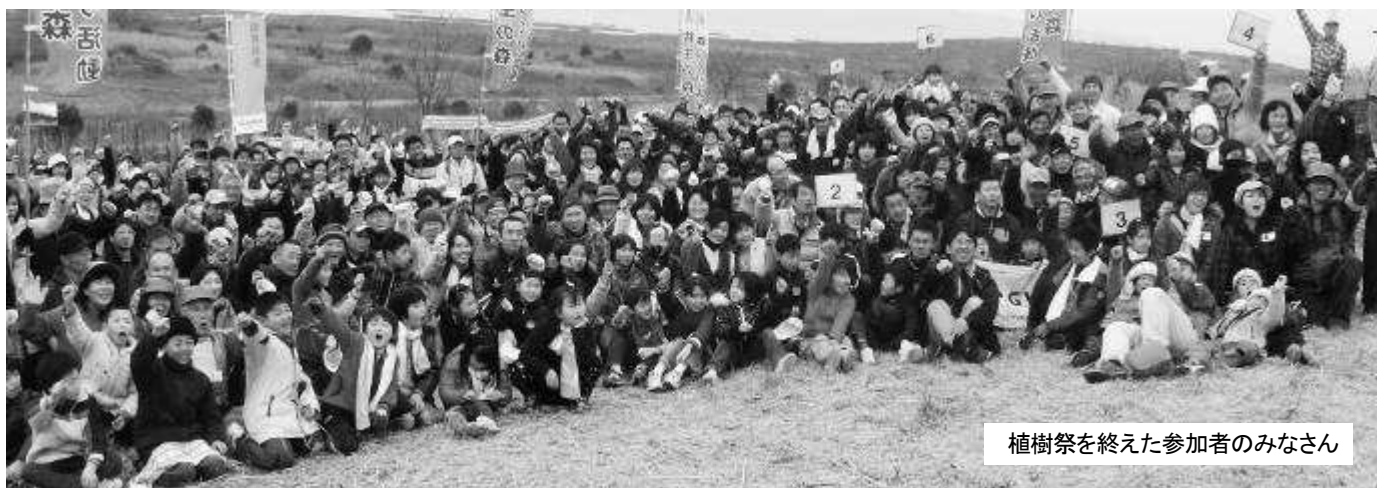
植樹祭を終えた参加者のみなさん

◆堺第7-3区において動植物を採集したり土や石などを持ち出すことは禁止していますので、ご協力をお願いします。